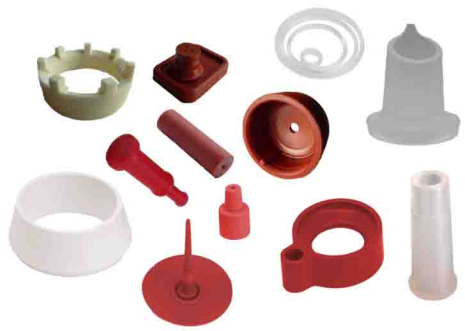
specific sealing solutions étanchéité spécifique

développement de solutions en : • étanchéité spécifique • sous-ensembles bi matière (TP + silicone LSR auto-adhérent) pour les marchés de la cosmétique