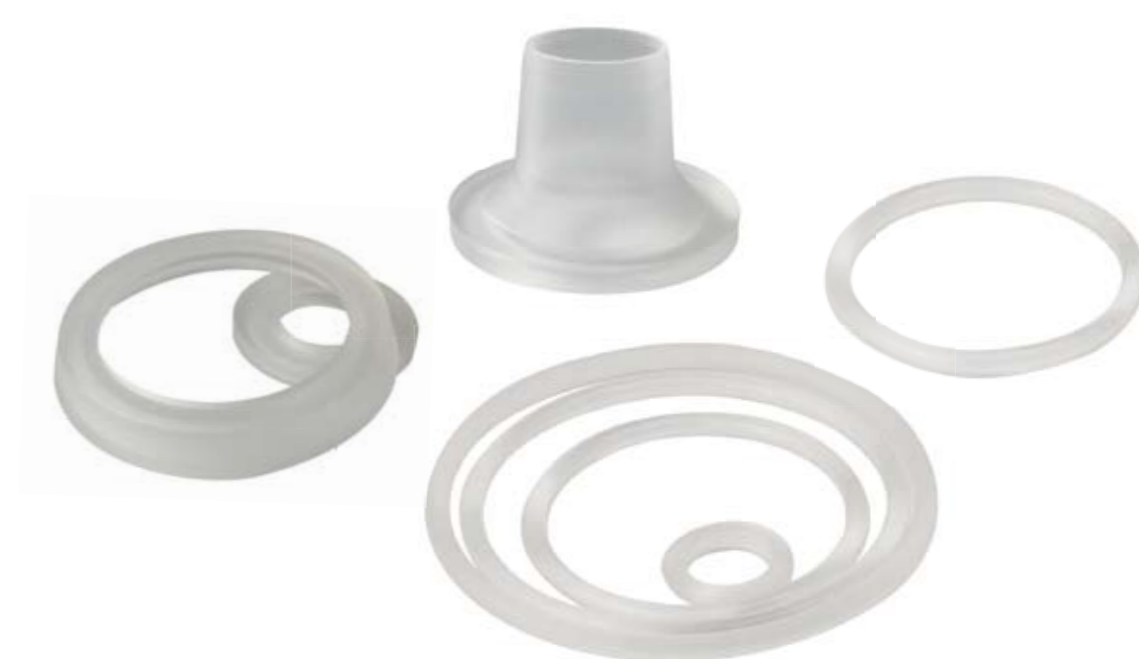
specific seals étanchéité spécifique