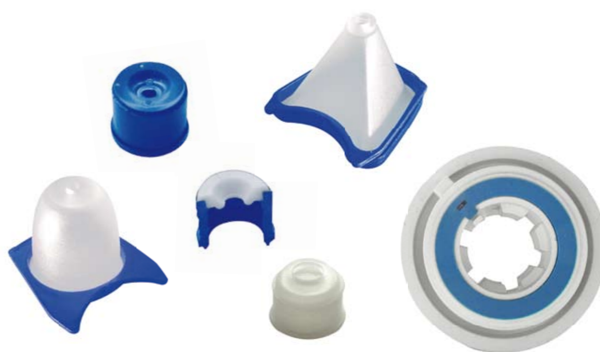
2 components parts sous-ensembles bi-matière